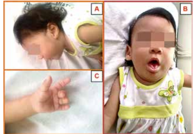
Figura 1. Algunos rasgos fenotípicos de la paciente. En A: Frente abombada, orejas de implantación baja, puente nasal deprimido, ojos hundidos. B: Cejas ralas, pliegues epicanáticos, philtrum corto, boca pequeña y revertida hacia abajo. C: Línea simiana izquierda.

La paciente, una niña de 10 meses de edad nacida por cesárea de una madre de 20 años, a las 33 semanas de edad gestacional, con un peso de 1576 g, talla: 38 cm, perímetro cefálico: 29.5 cm, perímetro torácico: 26 cm. El puntaje de Apgar fue de 8 al primer minuto y a los 5 minutos. Al examen físico presentó una facies dismórfica atípica con frente abombada, ojos hundidos, cejas ralas, puente nasal deprimido, con orejas de implantación baja, suturas cabalgadas, abdomen globuloso. El informe de neuropediatría revela en la ecografía transfontanelar una ventriculomegalia mínima sin hemorragia intraventricular. Los miembros superiores flexionados con hiperextensión, línea simiana. (Figura 1) El tercer dedo del pie izquierdo dorsiflexo cabalgando al cuarto. El informe cardiológico revela una persistencia del conducto arterioso de 1 mm y comunicación interventricular perimembranosa de 2 mm. Sople sistólico II/VI. Tono muscular levemente disminuido.