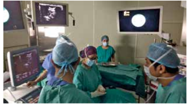
Figura 2. Equipo de cirugía fetal mapeando el borde de la placenta mediante ecografía para posteriormente insertar el trocar de 11 french.

Previo a la anestesia, se administró Nifedipino 20mg VO. Además de 50 mg de Ranitidina i.v., 10 mg de Metoclopramida i.v, Cefazolina 2g i.v. Se realizó monitorización ASA básica con preparación de equipo de vía aérea difícil. En posición decúbito lateral izquierda, previa asepsia y antisepsia se ubicó el espacio epidural L3-L4 a 5 cm de la piel; usando aguja Tuohy N° 18 y con técnica de pérdida de resistencia intermitente con aire, se llegó al espacio epidural sin complicaciones. Luego se